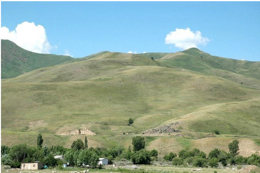
山の斜面での家畜の放牧（家畜は写真中央の斜面にかすかに見える）