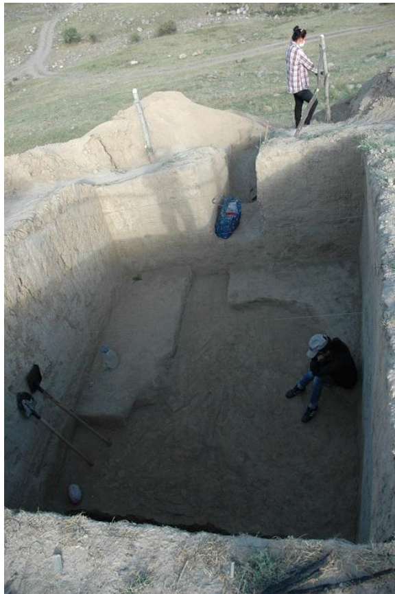
カラマ遺跡の発掘風景 (2)