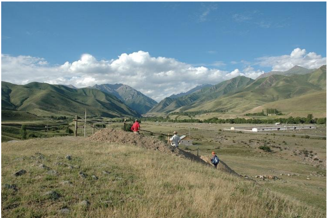
カラマ遺跡から眺望した天山山脈