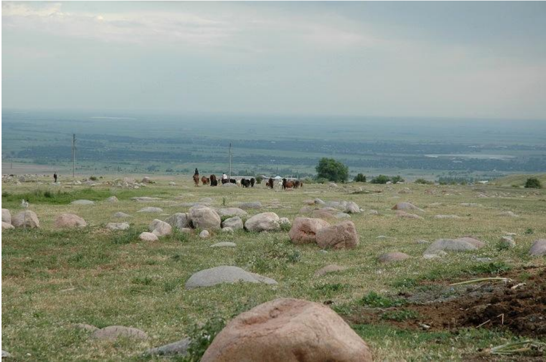
カラマ地域での家畜（馬、牛、羊）の放牧