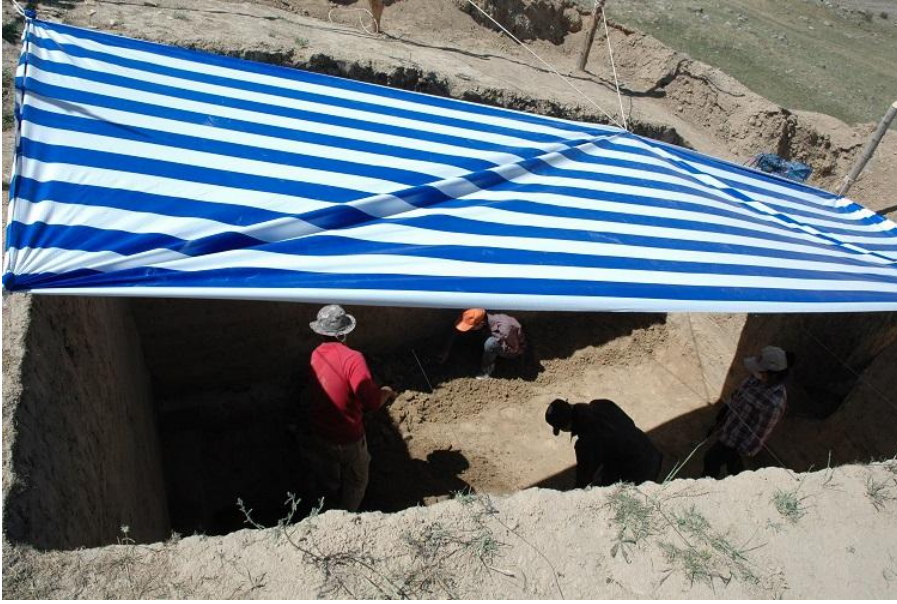
カラマ遺跡の発掘風景 (1)