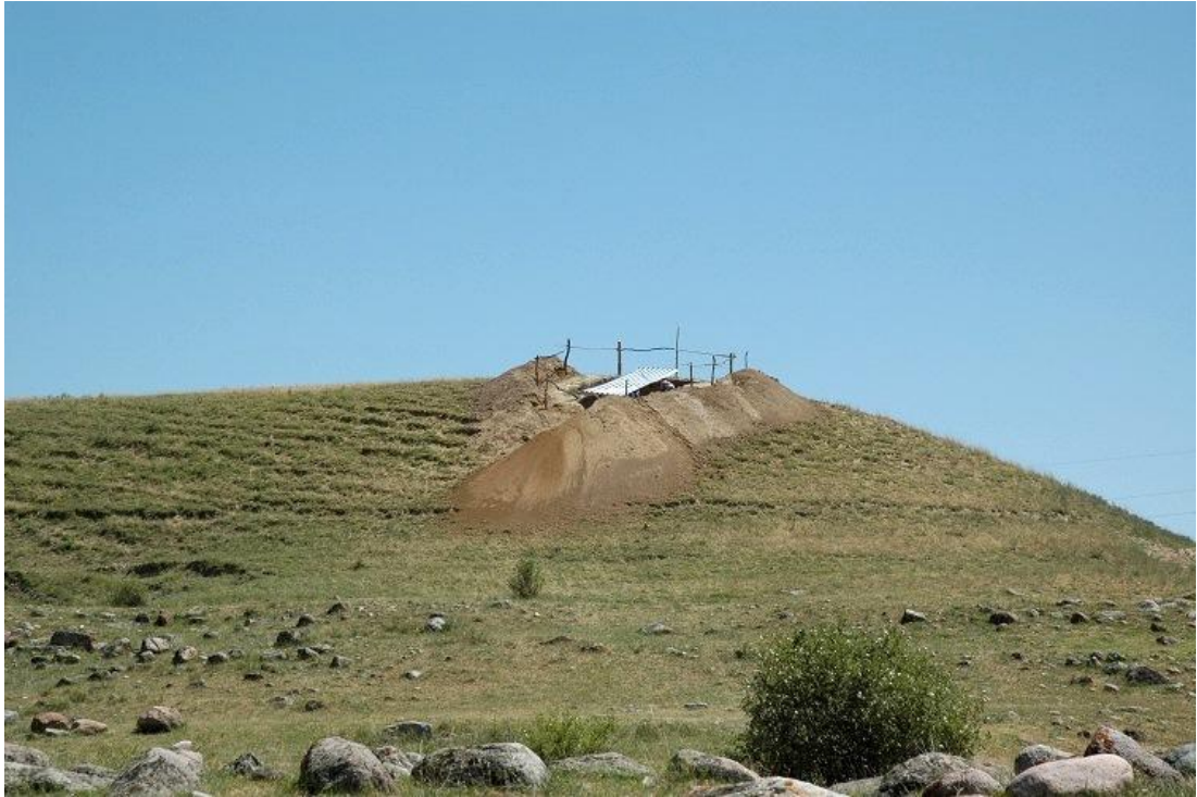
カラマ遺跡の遠景